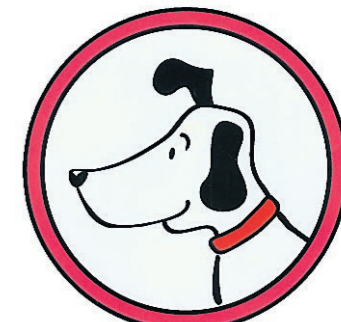
Rintje ILLUSTRATIE SIEB POSTHUMA